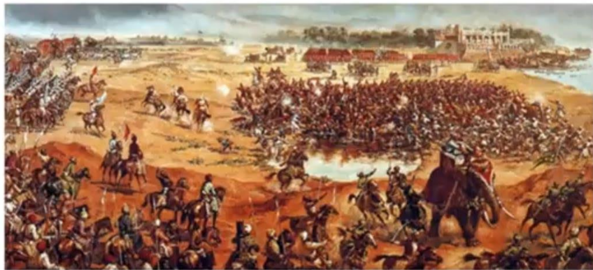
BATTLE OF PLASSEY