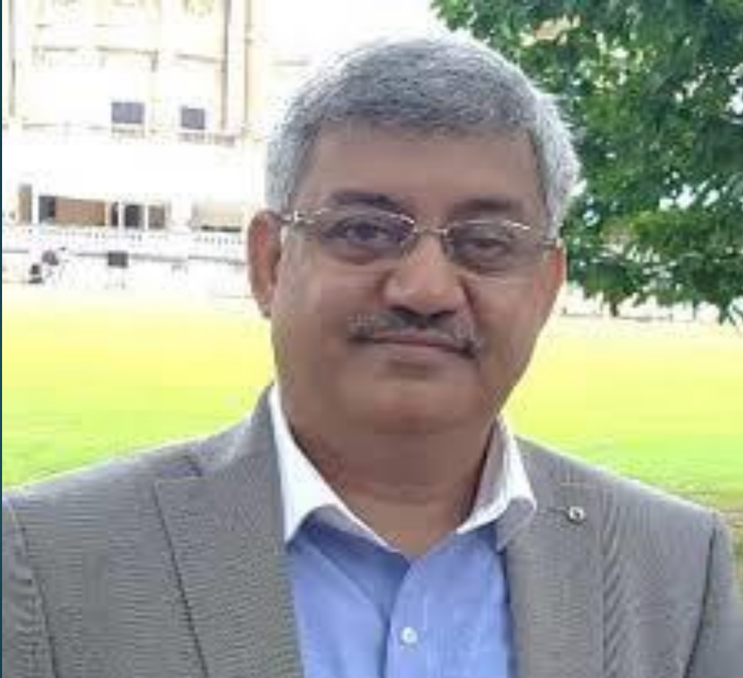
Sunil Barthwal, central provident fund commissioner