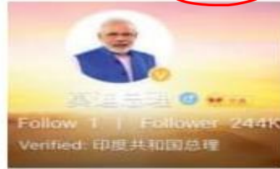
An earlier view of the PM's official Weibo page.

Both had photographs of Mr. Modi with Chinese Pre-