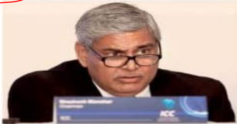
Turning it around: Shashank Manohar played a significant role in realigning the ICC's revenue model.

aspirant for the chairman's post – BCCI president Sourav Ganguly remains a rank outsider – The Hindu understands that England's Colin Graves is the favourite to assume responsibility during the ICC's annual conference,