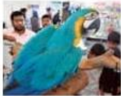
Blue and gold macaws are popular exotic pets.

The move comes as the outbreak of COVID-19 has raised global concern about illegal wildlife trade and zoonotic diseases. “Considering the significance of the im-