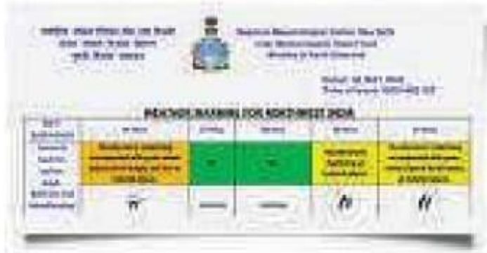
An image grab from the IMD bulletin

AARON PEREIRA & AMITABH SINHA NEW DELHI, PUNE, MAY 6