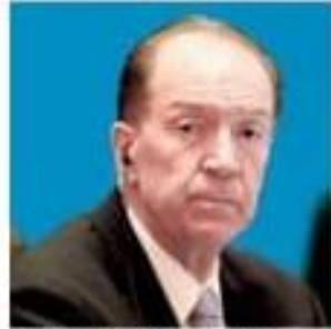
World Bank head David Malpass.

“We’re expecting a major global recession – our estimates suggest a much deeper downturn than the Great Recession [2007-09],” he said. The World Bank had recently projected a 1.5%-2.8% growth rate in this fiscal