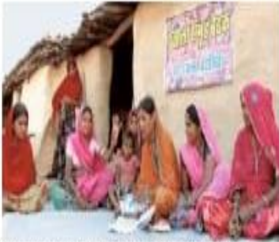
A women's group in Rajasthan's Udaipur district holds a

With local panchayat functionaries busy grappling with the consequences of the nationwide lockdown, a cluster of women's groups in Udaipur district's Salumbar block have started an initiative to help the most vulnerable households and to fight fake news and misinformation about the COVID-19. They have also