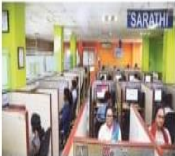
A view of Sarathi 104 office in Guwahati. •SPECIAL ARRANGEMENT

The information that helped the frontline staff locate these people invariably came from a building in Gu-