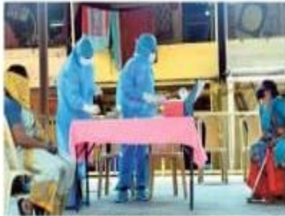
Testing times: Health workers collecting samples for testing from the residents of Bhatwadi in Mumbai.

Addressing the Union Health Ministry's daily press briefing, the ICMR's Head of