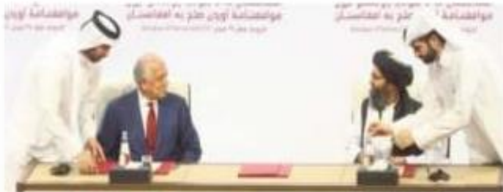
U.S. peace envoy Zalmay Khalilzad and Taliban leader Mullah Abdul Ghani Baradar signing a peace deal on February 29.

The Taliban said its peace deal with the U.S. was nearing a breaking point, accusing Washington of violations that included drone attacks on civilians, while also chastising the Afghan government for delaying the release of 5,000 Taliban prisoners promised in the