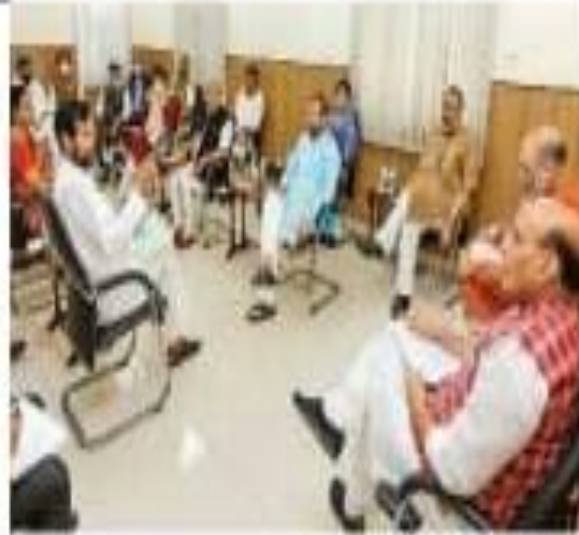
संसदीय कार्य के दौरान के दौरान को लेकर उच्चतम न्यायालय (जीओएम) को देखा है। इससे लॉकडाउन या कोई फैसला नहीं लिया जाए, लेकिन शिक्षण संस्थानों और धार्मिक स्थलों को 15 मई तक बंद रखने की सिफारिश सरकार की

एक महीने 4016 लोगों को घर लाने के लिए सरकार ने आदेश दिया है। इस आदेश के अन्तर्गत देश भर में एक महीने तक शिक्षण संस्थानों को बंद रखने की सिफारिश की जा सकती है। इस आदेश के अन्तर्गत देश भर में एक महीने तक शिक्षण संस्थानों को बंद रखने की सिफारिश की जा सकती है।