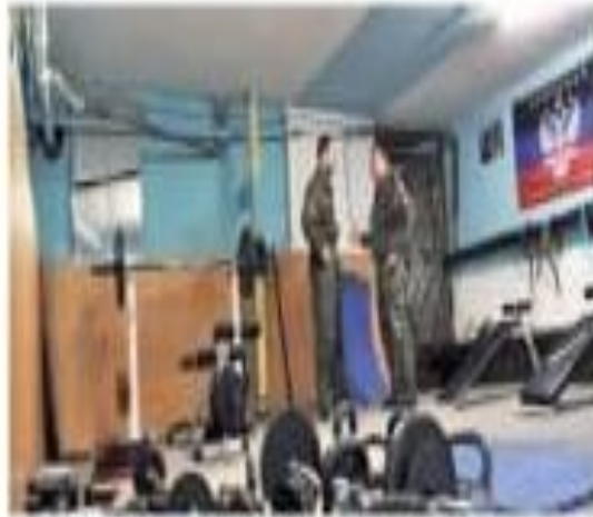
Threat of different nature: A training session of the Russian Imperial Movement in St. Petersburg in 2015.

While the label of specially designated global terrorist has been frequently used for