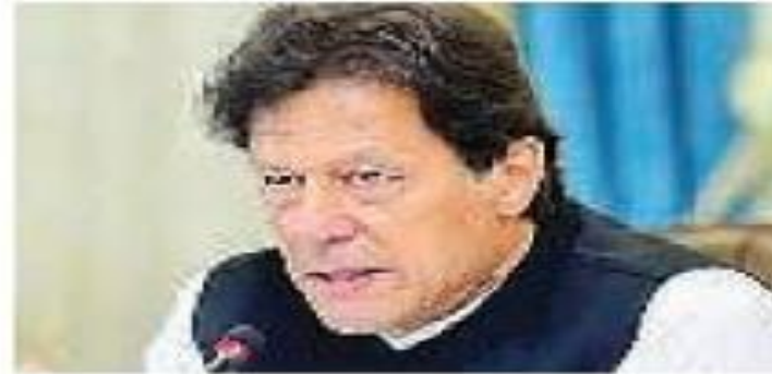
पाकिस्तान के पीएम इमरान खान।

फिलहाल एफएटीएफ की 'ग्रे' लिस्ट में है पाकिस्तान