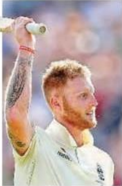
बेन स्टोक्स

विजडन क्रिकेटर्स अलमनैक ने 2020 के अपने संस्करण में 2019 के प्रदर्शन के लिए स्टोक्स को यह सम्मान दिया, जो इससे पहले लगातार तीन वर्षों तक कोहली को मिल रहा था। विराट को 2016, 2017 और 2018 में लगातार तीन बार विजडन