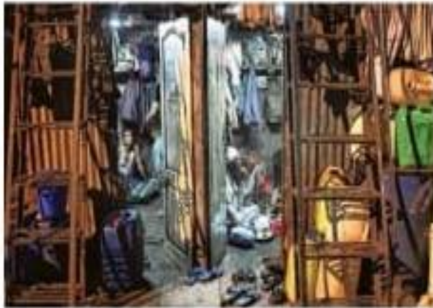
No breathing space: Maintaining social distance in the wake of COVID-19 is a distant dream in Dharavi.

Brihanmumbai Municipal Corporation has been holding health camps in these containment zones and so far, more than 3220 people have been screened for symptoms. Six are considered highly probable and have been quarantined already. In all, 78 people have been actually tested for the virus in Dharavi.